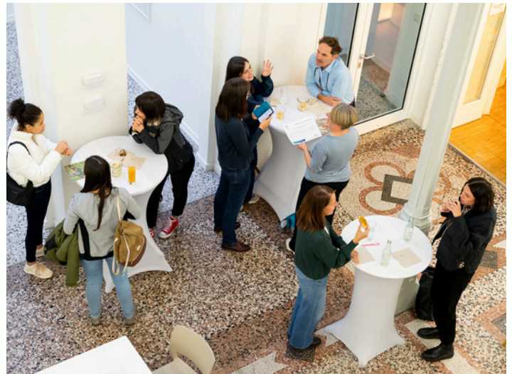
Austausch zwischen Teilnehmenden und Sprecher:innen in der Pause des GEN2030+ Events.

Die Post-2030-Debatte darf nicht ohne junge Stimmen geführt werden. Um eine bessere Gegenwart und Zukunft für alle zu schaffen, braucht es Plattformen und ausreichend Finanzierung für die verbindliche Mitgestaltung junger Menschen einschließlich unterrepräsentierter Gruppen, heute, nicht erst morgen.