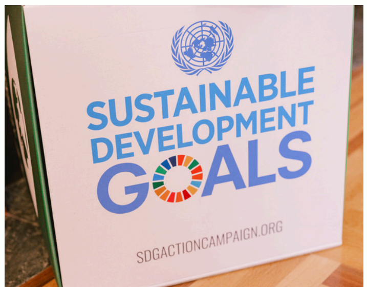
© BKMF - Martin Krachler / SDG Würfel.