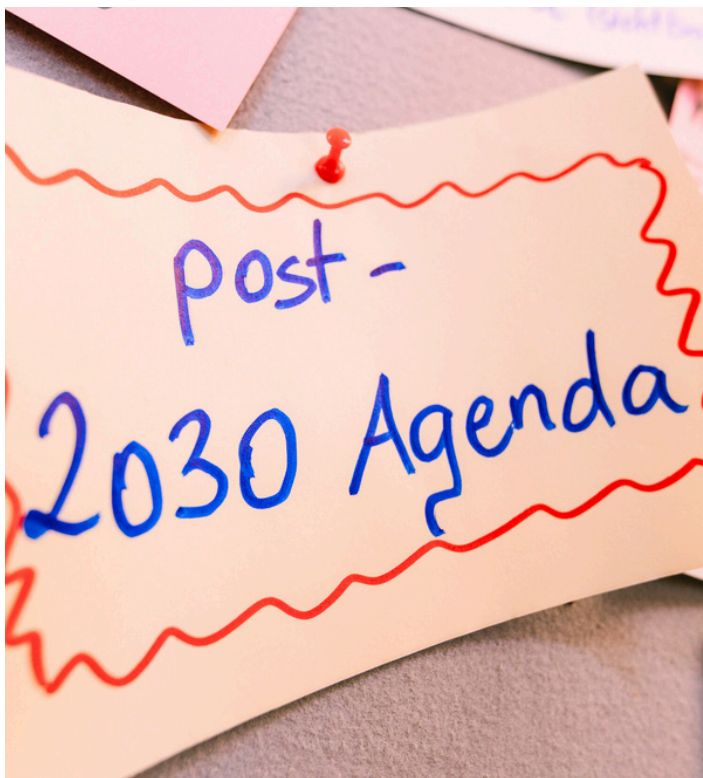
Post-it 2030 Agenda.

Wie können junge Menschen daran mitwirken, nicht nur beratend, sondern auch entscheidend?