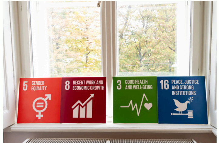
SDG Signs - 5, 8, 3, & 16.

Die Vorstellung von drei inspirierenden Pilotprojekte von jungen Menschen, die mit innovativen Aktionen ihre Umgebung verändert und nachhaltiges Denken in Bewegung gebracht haben, stand im Zentrum des Vormittagsprogramms des SDG-Dialogforums „SDGs in Bewegung“ :