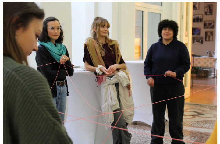
Teilnehmende von „SDGs in Bewegung“ bei einem interaktiven Spiel, das die Verknüpftheit der SDGs mithilfe von Netzen veranschaulicht.

Auf die Frage „Wie kann ich zu einer guten Zukunft beitragen?“ nannten viele den Wunsch, Vorbilder zu sein, den Dialog zu fördern und bewusst, achtsam und optimistisch zu handeln – sei es durch Aktivismus, Bildungsarbeit oder kleine Alltagsentscheidungen. Wichtig ist dabei das Gemeinsame: Austausch, Mitstreitende und Netzwerke werden als Grundlage für wirksames Engagement gesehen. Gleichzeitig wurde betont, dass Engagement strukturelle Unterstützung braucht: Sichtbarkeit, Ressourcen, politische Offenheit und niederschwellige Zugänge sowie Rückhalt in Familie, Arbeit oder Gemeinschaft. Liebe, Empathie und Verständnis für unterschiedliche Lebensrealitäten helfen, den Dialog produktiv zu gestalten und nachhaltige Wirkung zu erzielen.