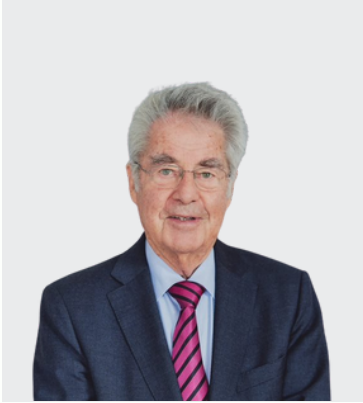
Dr. Heinz Fischer, Altbundespräsident der Republik Österreich.

„Junge Menschen brauchen immer einen fixen Platz am Tisch, nicht nur, wenn es um „Jugendthemen“ geht.“