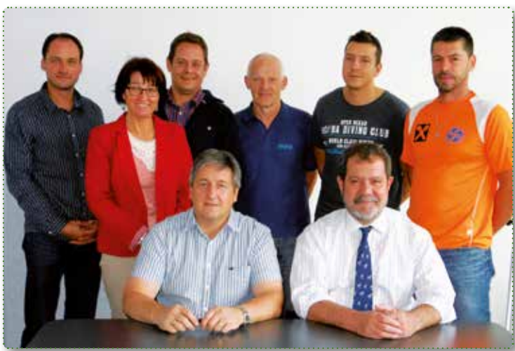
Das MSG Umweltteam

Der Fokus ist auf Komponenten und Systeme im Automotive Bereich ausgerichtet und umfasst alle Gebiete der Aktuatorik und Sensorik.