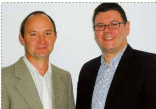
Das Nahwärme Gleinstätten Umweltteam

Insgesamt versorgen wir über 300 Objekte in den Gemeinden – es sind dies die Schulen, Kindergärten, öffentliche Einrichtungen, Hotels- und Beherbergungsbetriebe, Industrieobjekte, Gewerbebetriebe, Pflegeheime, Mehrparteienwohnhäuser und private Haushalte.