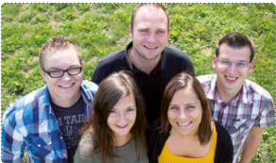
Das LOGICDATA Umweltteam