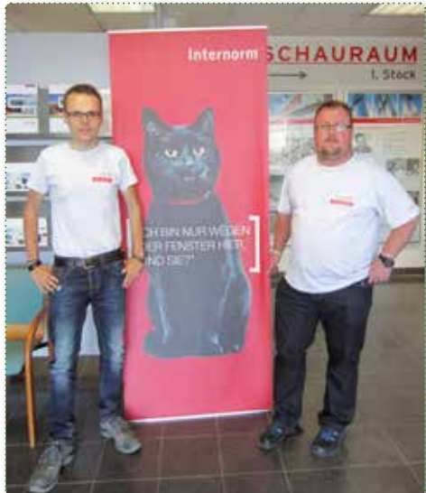
Das Internorm Umweltteam

Internorm ist die größte international tätige Fenstermarke Europas und Arbeitgeber für mehr als 1.800 Mitarbeiter. Gemeinsam mit mehr als 1.250 Vertriebspartnern in 20 Ländern baut Internorm seine führende Marktposition in Europa weiter aus.