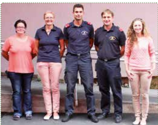
Das Landesfeuerwehrverband Umweltteam