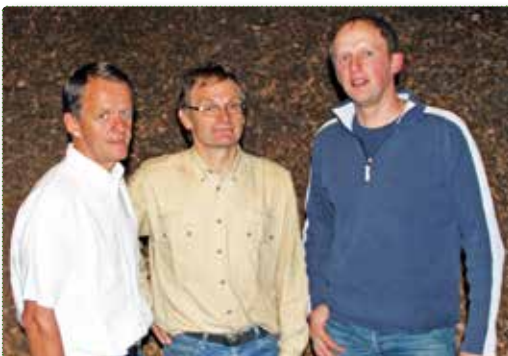
Das Nahwärme Eibiswald Umweltteam

Die Vorteile für unsere Kunden liegen in der Regionalität, der größtmöglichen Umweltverträglichkeit, im hohen Komfort und der verlässlichen Preissituation dieser Wärmeversorgung.